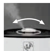
Difusor de nebulización regulable y orientable 360°C.