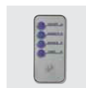
Mando a distancia.

Humidostato electrónico para seleccionar con precisión la H.R. entre 45 – 90%. 3 caudales de nebulización y difusor orientable 360°. Temporizador programable de 1-12 h. Indicador en pantalla y acústico de depósito de agua vacío. Mando a distancia para control remoto. Filtro para impurezas del agua.