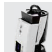
Depósito extraíble de 4,7 litros.