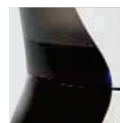
Visor de nivel de agua.